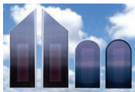
SV12 og SV28 Freeline SV9 Rounded

SV14 Hybrid Slimline - varm luft og varmt vand. 80 liters beholder, ingen pumpe (selvcirkulerende) - alt soldrevet.